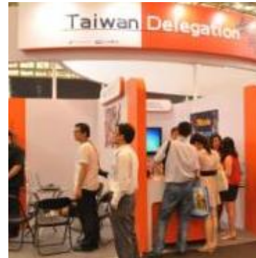
China Joy 台灣館