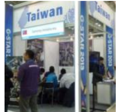
韓國 G-STAR 台灣館