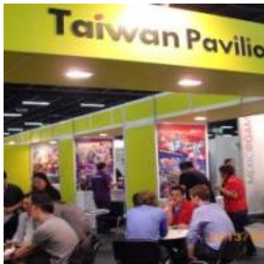
德國 Gamescom 台灣館