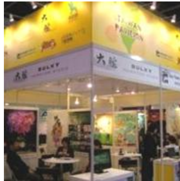
香港 FILMART 台灣館